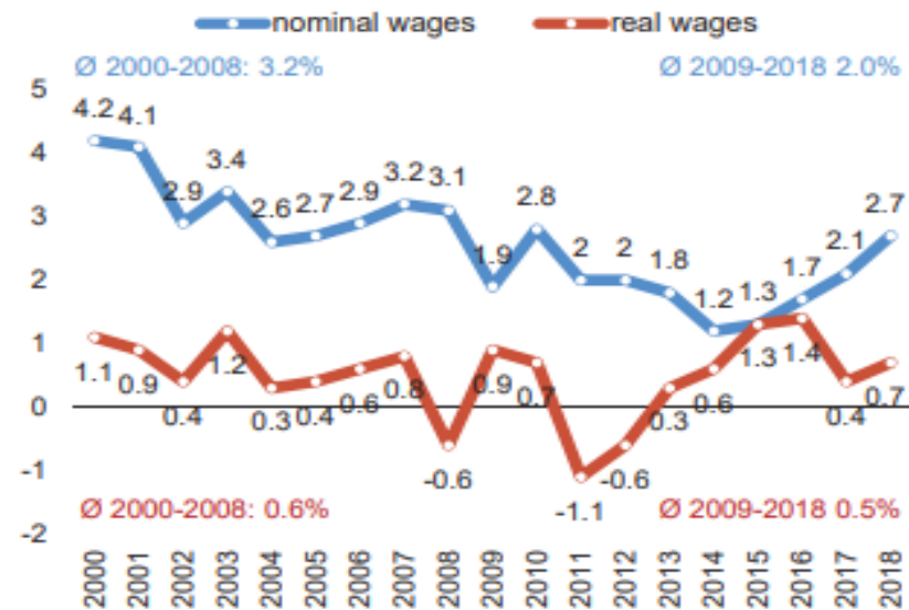
Figure 3.2 Development of nominal and real wages over time in the EU28, 2000–2018 (change in percentage compared to previous year)