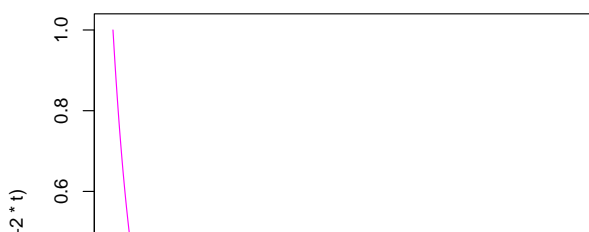
Gráfico de Y = \exp(-2T)

CLASES PARTICULARES, TUTORÍAS TÉCNICAS ONLINE LLAMA O ENVÍA WHATSAPP: 689 45 44 70