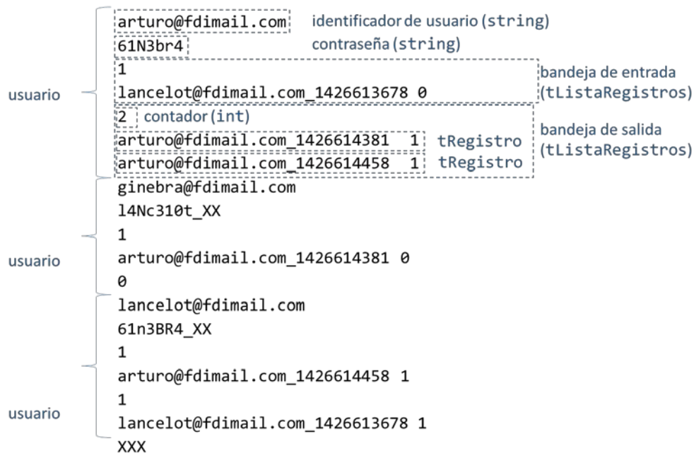
Figura 7. Ejemplo de fichero con una lista de usuarios

La Figura 7 muestra el contenido de un fichero de ejemplo de nombre genérico <NombreDominio>_usuarios.txt que contiene la lista de usuarios del sistema ordenada por orden alfabético del identificador de usuario y que acaba con el centinela XXX.