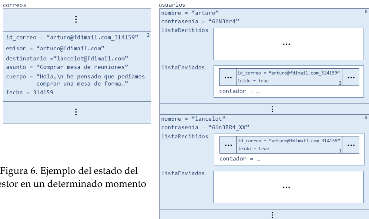
Figura 6. Ejemplo del estado del gestor en un determinado momento

enviados de “arturo” y en la de recibidos de “lancelot”. Sin embargo, el correo propiamente dicho sólo se encuentra una vez en la lista de correos del gestor.